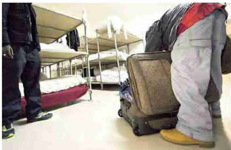
Une cinquantaine de requérants sont attendus dès le 23 janvier à l'abri PC de la Damataire.