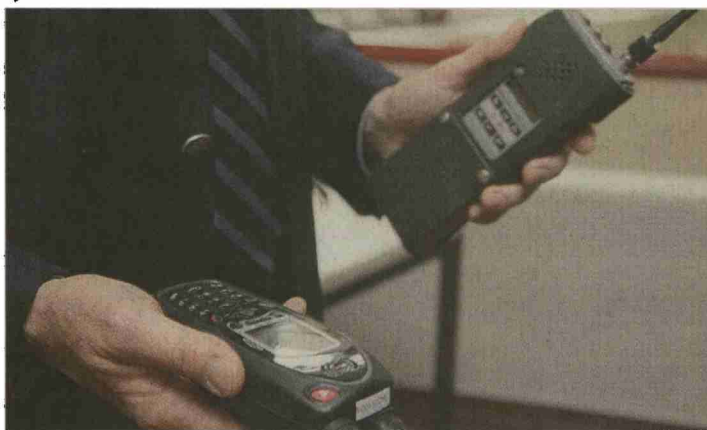
Un équipement performant pour répondre à la demande. MAMIN

Autre avantage de Polycom: outre la voix, il peut aussi transporter des photos de personnes recherchées. Cette fonction n'équiperait pas pour l'instant les radios valaisannes. ●